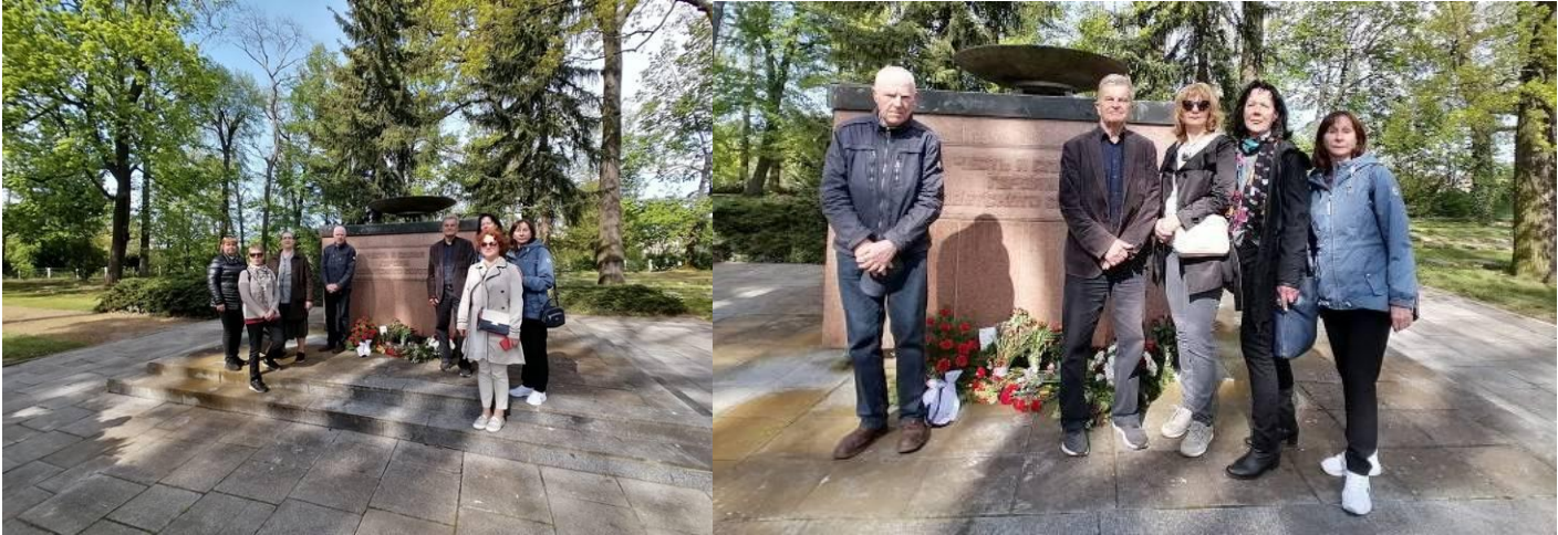
Kranzniederlegung von Deutsch-Russländischer Gesellschaft auf sowjetischen Ehrenfriedhof in der Stadt Wittenberg am 8. Mai 2023