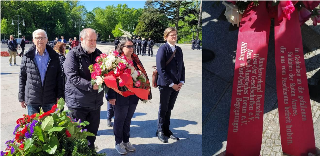
Gemeinsame Kranzniederlegung durch die Stiftung West-Östliche Begegnungen, das Deutsch-Russische Forum und den BDWO am Sowjetischen Ehrenmal in Berlin-Tiergarten am 9. Mai 2023