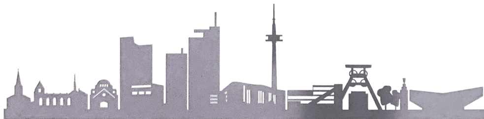
Thomas Kufen Oberbürgermeister der Stadt Essen