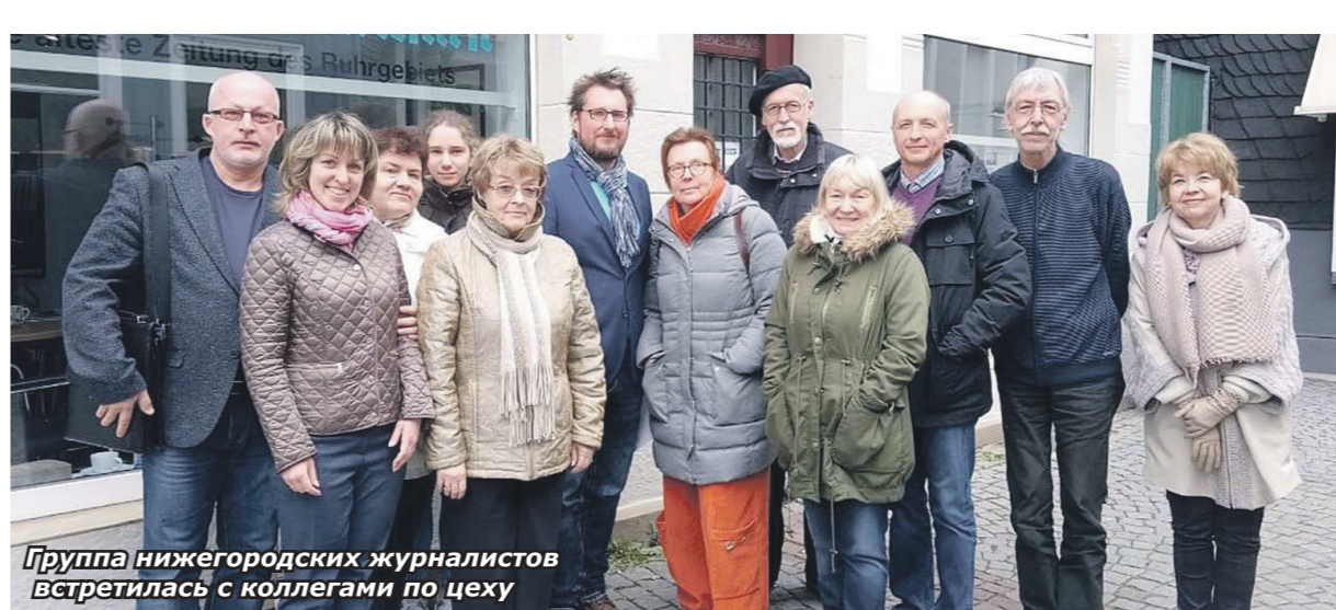
Группа нижегородских журналистов встретила с коллегами по цеху