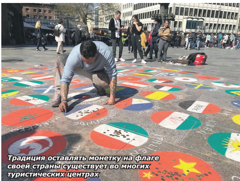
Традиция оставлять монетку на флаге своей страны существует во многих туристических центрах

Пока мы беседовали, к платформе стремительно подошёл двухэтажный поезд, и через час мы уже были на месте. КАФЕДРАЛЬНЫЙ собор святых Петра и Марии в Кёльне – шедевр мирового зодчества. В нём впечатляет всё – масштабы, величественная готическая архитектура, ценнейшие христианские реликвии. Самой уникальной из них является ковчег (рака) Трёх Волхвов, пришедших в Иерусалим с востока поклониться родившемуся Иисусу Христу. Ещё одна жемчужина – знаменитая Миланская Мадонна – одно из красивейших скульптурных творений в мире. Это изображение Богоматери, дошедшее до наших