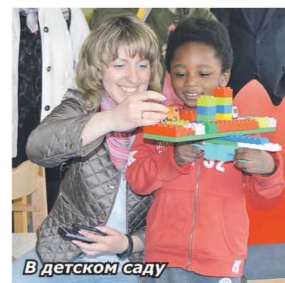
В детском саду

ОСОБЕННО эмоциональным стало посещение детского сада. Кстати, он полудневный, что нетипично для этой страны, где большинство таких учреждений работает с 7 до 12 часов. В него ходят 80 детей от года до шести лет, всего четыре группы по 18 человек. Ребятам не разделены ни по возрасту, ни по национальности. В каждой группе – три воспитателя. Оказываются, их, как и учителей, на рынке труда не хватает. Детишки были приветливы, очень хотели сфотографироваться с нами,