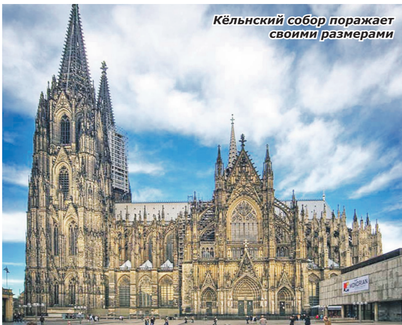
Кёльнский собор поражает своими размерами